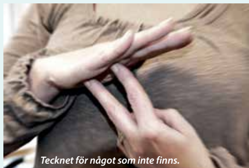
Tecknet för något som inte finns.