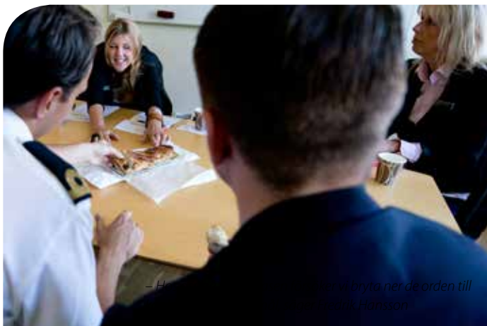
– Hos oss på Marinbasen försöker vi bryta ner de orden till konkreta handlingar.

På vår webbplats står det att "Försvarets värdegrund slår vakt om alla människors lika värde, rättvisa och jämlikhet och främjar demokrati och mänskliga rättigheter. För att våra uppdrag ska vara framgångsrika förutsätts att alla medarbetare uppträder enligt värdegrunden."