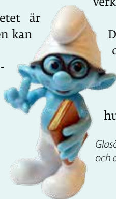
Glasögonsmurfen, en av 100 smurfar och den ingen vill vara.